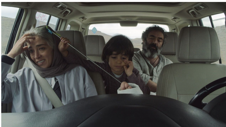
Hit the road de Panah Panahi