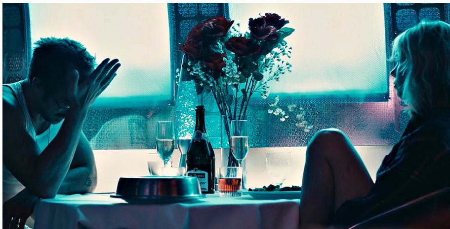
Blue valentine de Derek Cianfrance