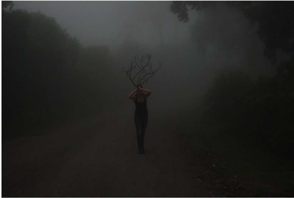
Recherches autour de la figure du cerf.