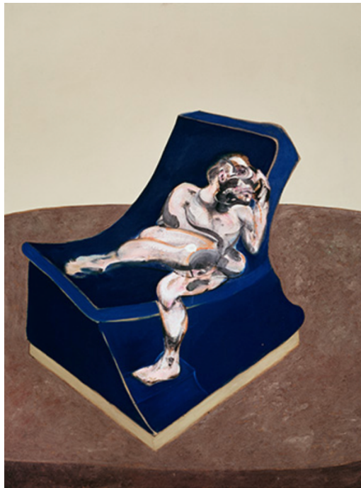
© Three figures in a room de Francis Bacon 1964