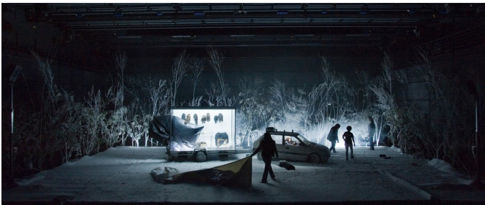
La mélancholie des dragons de Philippe Quesne