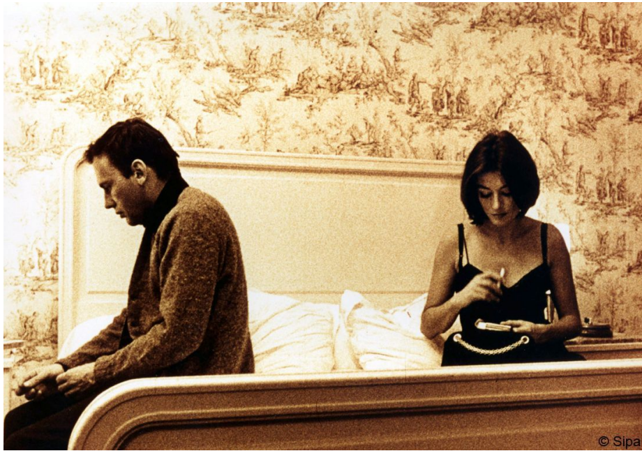
Anouk Aimée et Jean-Louis Trintignant dans Un homme et une femme de Claude Lelouch. 1966